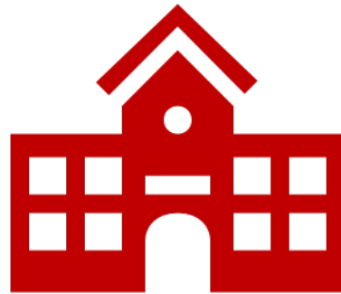
Escuela Preparatoria de Shelton